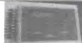
TESTER MICROGAS REGULADOR DE PULMON ADULTO PEDIÁTRICO Y NEONATAL