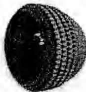
Copa SeleXys TH+ Tetrahedron ( THR )

Material: Ti6Al7Nb ( ISO 5832-2 ) Proteport® ( ISO 5832-2 )